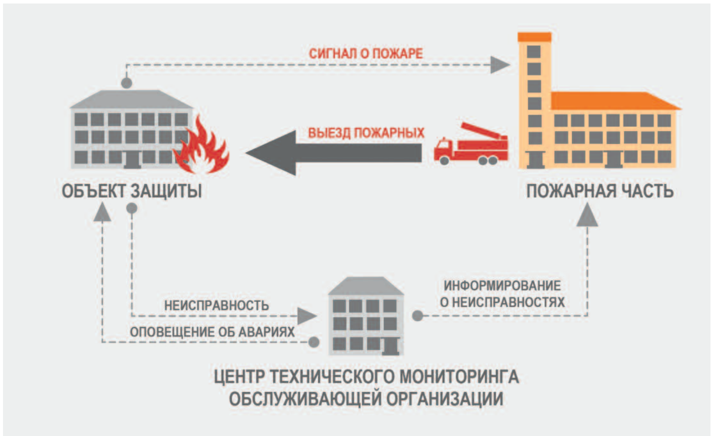
▲ Схема передачи сигналов “Пожар” и “Неисправность” с объектов защиты

извещений, а также (при наличии обратного канала) для передачи и приема команд телеуправления.